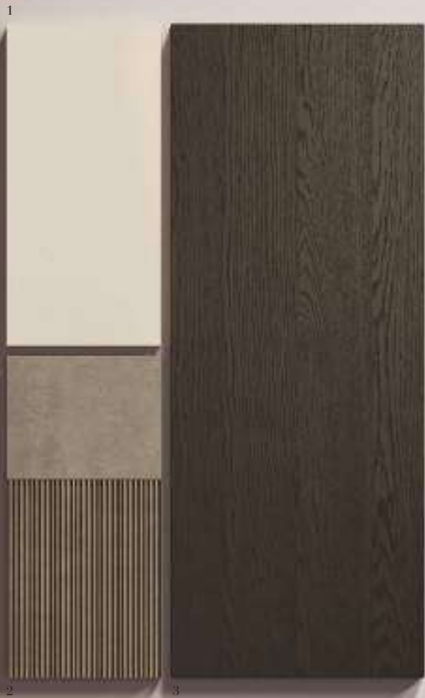
1. Bluna Tech Opaco Grigio Pietra 2. Worktop in Gres Fokos Terra Opaco 3. Bluna Bilaminato Legno Rovere Quercia

In the Bluna Tech Matte environment, the kitchen area redefines the concept of living by expanding its horizons, extending towards the dining area, which is centered around the Moor table, and towards the living room. The leitmotif of the entire project is the striped pattern of the sink monoblock and the backsplash in the living area. Complementing the Tech Matte Grigio Pietra base units is the wardrobe in Bilaminate Legno Rovere Quercia. The columns are surprising with the possibility of access from multiple sides through an opening leading to the pantry area, characterized by the refined and sleek design of the Hide equipped wall. In the living room, a play of combinations and volumes creates spaces designed not only for storage but also for entertainment, meditation, and work.