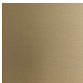
Ottone Naturale Satinato