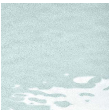
naturale effetto satinato natural satin finish