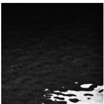
nero brillante brilliant black

Piano in vetro fuso retroverniciato Back-painted fused glass top