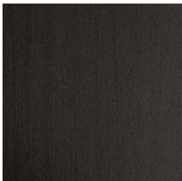
termotrattato nero heath-treated black