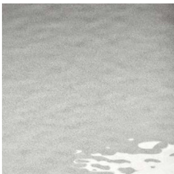
fumo smoke grey

Piano in vetro fuso retroverniciato (finitura semi-trasparente) Back-painted fused glass top (semi-transparent finish)