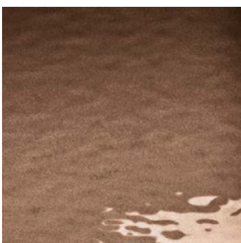
marrone brillante brilliant brown